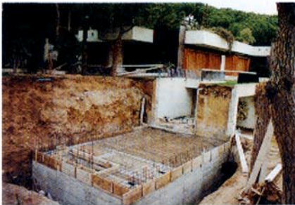
Construcción de un refugio unifamiliar adosado a un chalet. 300 toneladas de hormigón armado.

El chalet, aunque imponente por sus dimensiones, es de un austero y elegante estilo castellano. El jardín luce espléndido al sol a pesar del frío del invierno. Pasamos al vestíbulo, nos dirigimos a la zona de servicios, bajamos una escalera y, ya en el sótano, pasamos junto a una espléndida y bien surtida bodega para llegar finalmente al squash y junto a él, a la puerta del refugio.