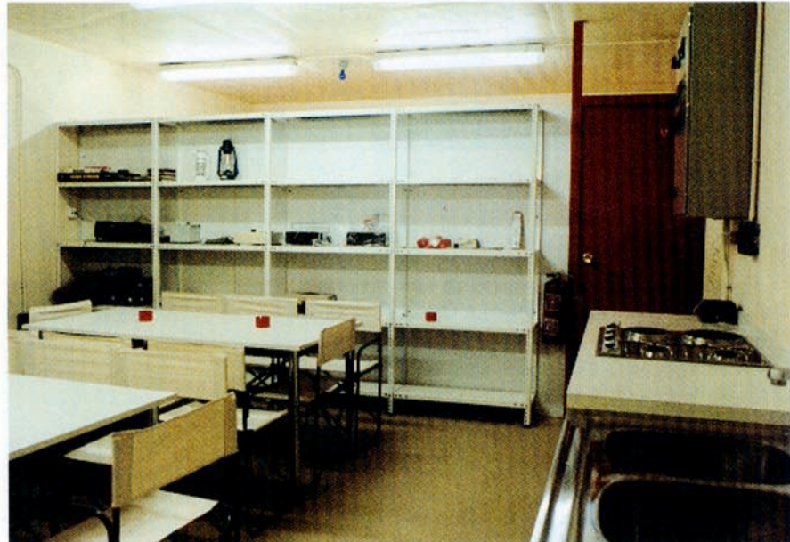
Distribución funcional de un refugio. Sala de estar, cocina, cuadro eléctrico y, al fondo, dormitorios con luz azul de noche.