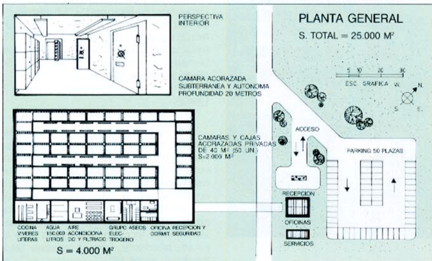
Proyecto de complejo de cámaras y cajas acorazadas en copropiedad (Barcelona).

Si en las casas existen pararrayos y extintores, si los aviones y barcos llevan chalecos salvavidas, si los coches disponen de cinturones de seguridad, si las personas contratan seguros de vida, no deja de ser sorprendente que al construir una nueva vivienda, o aprovechando obras o ampliaciones, no se construya un refugio que además de dar la máxima seguridad posible a la familia, permite disfrutarlo en tiempo de paz por mucho tiempo.