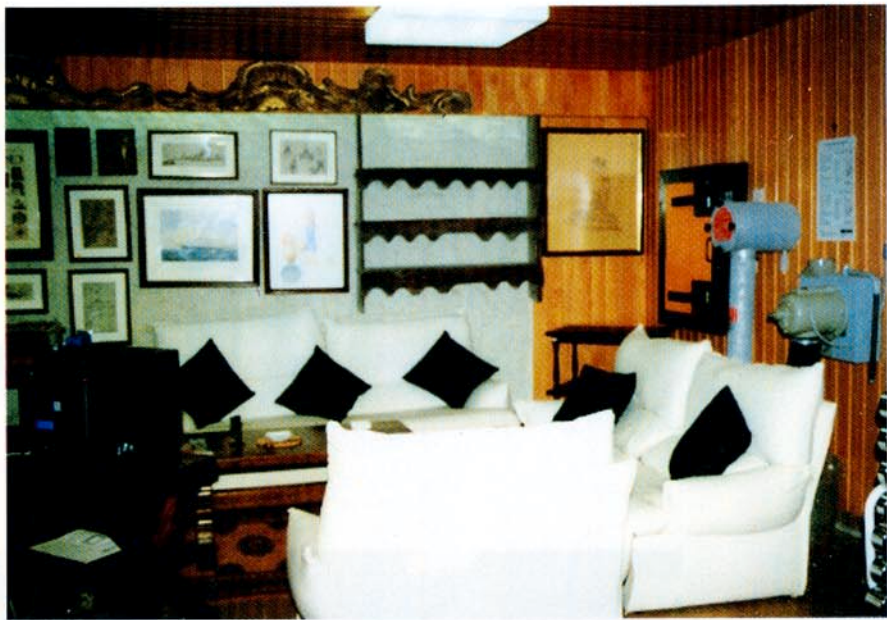
Refugio antiatómico unifamiliar. Al fondo, salida de emergencia y sistema de filtros.

En Suecia existen unos 7.000.000 de plazas protegidas, el 80% de la población. Las empresas disponen de refugios antiatómicos para los trabajadores. En Noruega la construcción de refugios es también obligatoria. Existen 1.500.000 plazas en refugios privados y 180.000 en refugios públicos. En Dinamarca hay 2.400.000 plazas protegidas, más del 50% de la población mientras que en Finlandia 2.500.000 personas estarían protegidas en refugios en gran parte bajo roca y con capacidad de 800 personas. Rusia cuenta con 175.000.000 de plazas, el 70% de la población, mientras que en Estados Unidos se han contabilizado unos 100.000.000 de plazas protegidas. En Israel, al igual que en Suiza, la práctica totalidad de la población dispone de refugios antiatómicos. En España se calcula que hay unos doscientos y pico refugios con capacidad para unas 10.000 personas.