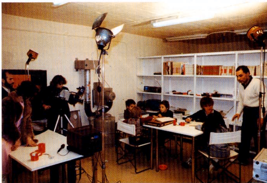
Sesión de vídeo familiar en un refugio, los niños son, tal vez, los más beneficiados de este sistema de seguridad.