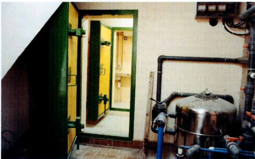
Refugio combinado con local de depuradora de piscina. Puertas blindadas de 2 toneladas, esclusa y aseos.

El Vaticano tiene un gran refugio para 800 personas y todos sus archivos históricos. En Alemania existe un refugio a gran profundidad en el que se guardan copias microfilmadas de prácticamente toda la cultura actual. En Suiza, las Universidades, Bibliotecas