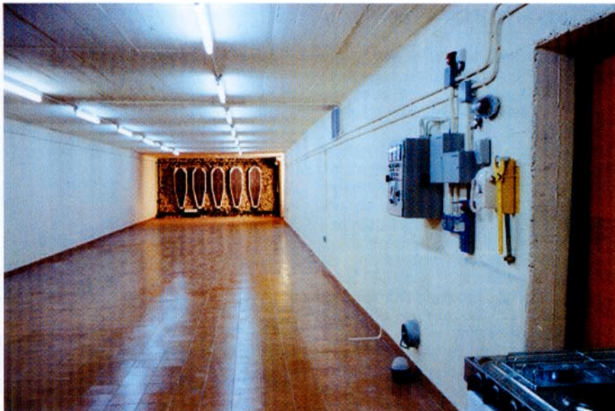
Galería de tiro olímpico, de 30 m de longitud, con siluetas mandadas por ordenador, proyectada en refugio para 100 personas.

Entre las tres puertas blindadas de la entrada se forma un local que tiene una función triple y muy importante. Además de ubicarse en él los aseos, tiene asignada la misión de esclusa de aire para poder entrar y salir del refugio incluso con contaminación gaseosa, y del local de descontamina-